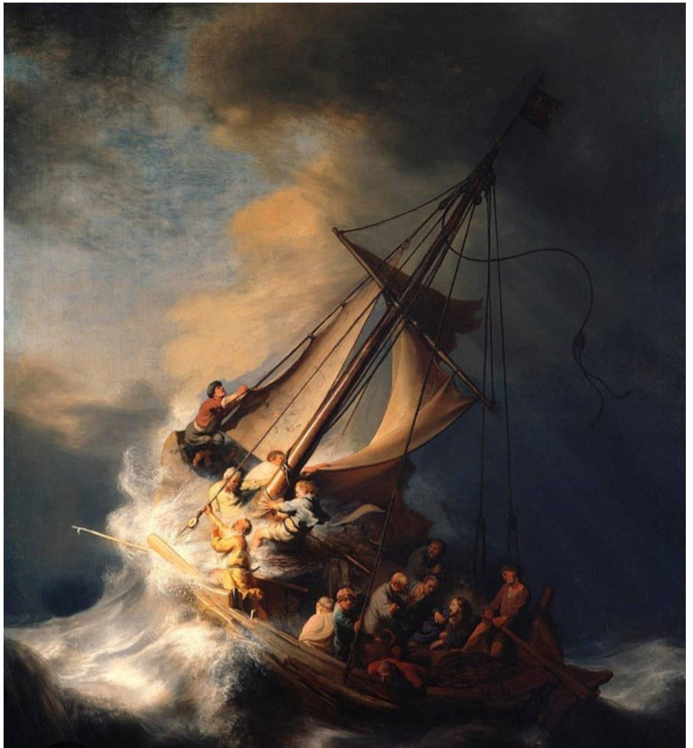
"De storm in de nacht. Schilderij van Rembrandt".

Paulus overdenkt in deze passage de betekenis van Christus' liefde, vooral van Christus' liefde die zich toont in Zijn zelfgave aan het kruis. Eens was hij, Paulus, een fanatieke bestrijder geweest van de jonge Kerk. Hij had in Christus een valse profeet gezien en de beweging rondom Hem als een gevaarlijke ondermijning van de Joodse godsdienst en gemeenschap. Maar toen Paulus eenmaal door Christus'